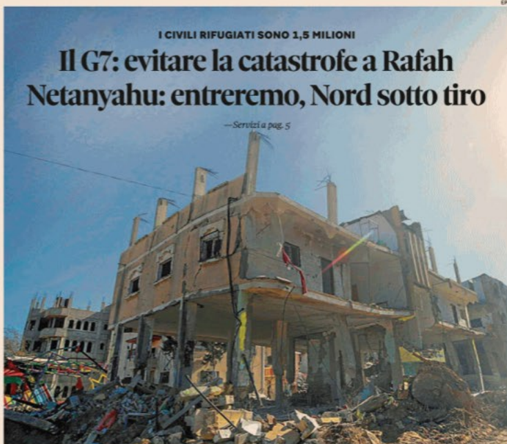
Tensione sempre alta a Gaza. Nuovi attacchi israeliani nel sud della Striscia. Colpito il campo profughi di Al Maghazi (nella foto)